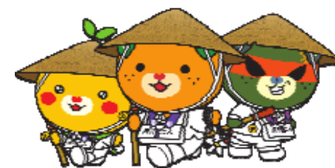
愛媛県イメージアップキャラクター みきゃん ダークみきゃん こみきゃん（許諾番号606058）

テーマに精通した各大学の先達さんから、実践で役立つ内容をお話ししていただきます！！